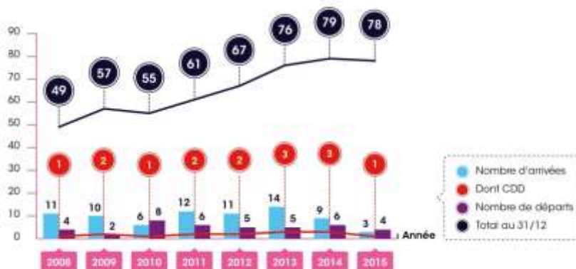
ÉVOLUTION DU NOMBRE DE SALARIÉS (CDD et formations en alternance inclus)

Les variations les plus marquantes concernant les charges d'une année sur l'autre sont les suivantes :